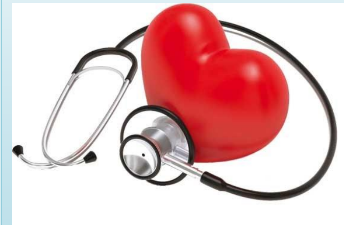
فشار خون‌های کنترل نشده عامل اصلی بیماری کلیوی

فشارخون بالا عامل مهم بیماری عروق کرونر قلب و ایسکمی قلبی و نیز سکته مغزی خونریزی دهنده می‌باشد و ارتباط مثبت و مستمر با آنها دارد. از دیگر عوارض فشارخون بالا نارسایی قلبی، بیماری عروق محیطی، خونریزی ته چشم است.